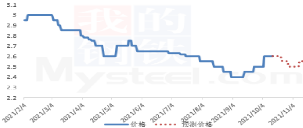
2021年赤峰黄金苗谷子价格走势预测图（元/斤）