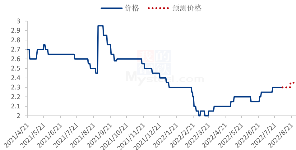
(2021-2022年) 赤峰张杂13号谷子价格走势 (元/斤)

产区持货粮商存在挺价心态，对原粮价格形成利好支撑，价格暂时稳定。Mysteel农产品认为短期谷价应无下滑风险，关注中下旬贸易主体操作变化，若出现集中压货或补货行为，价格或将小幅上调。