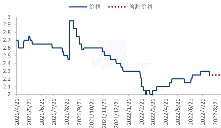
(2021-2022年) 赤峰张杂13号谷子价格走势 (元/斤)