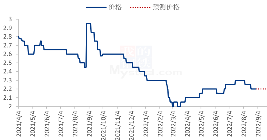
(2021-2022年) 赤峰张杂13号谷子价格走势 (元/斤)

9月开始新谷上市量增加，可供市场选择的新陈谷子货源较多，市场供应面宽松，价格存在回落风险。10-11月份陈粮或在市场流通，届时供应压力明显，价格回落风险或将持续，另外还需关注贸易主体心态及操作情况。