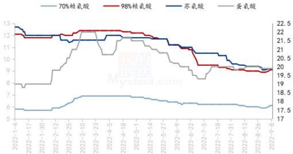
国内氨基酸市场价格走势图（单位：元/公斤）