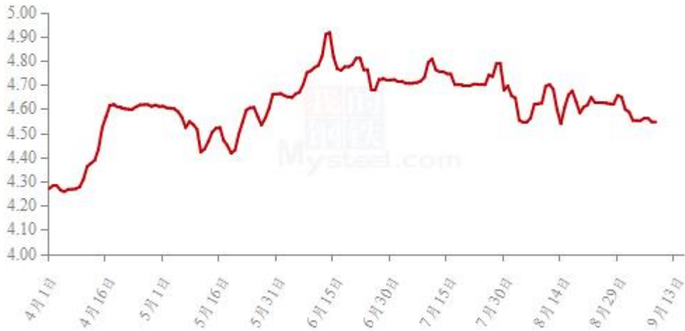
全国白羽肉鸡均价走势图（元/斤）