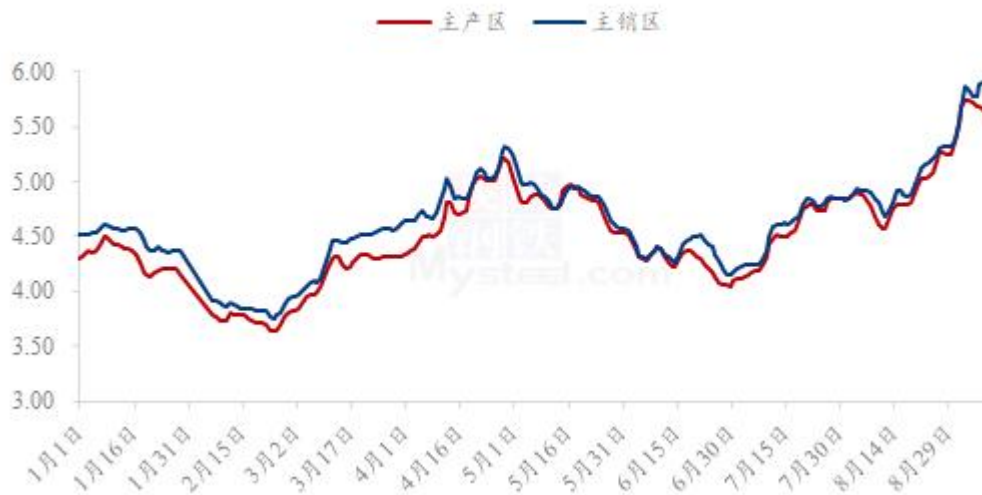
全国鸡蛋主产区与主销区价格对比图（元/斤）