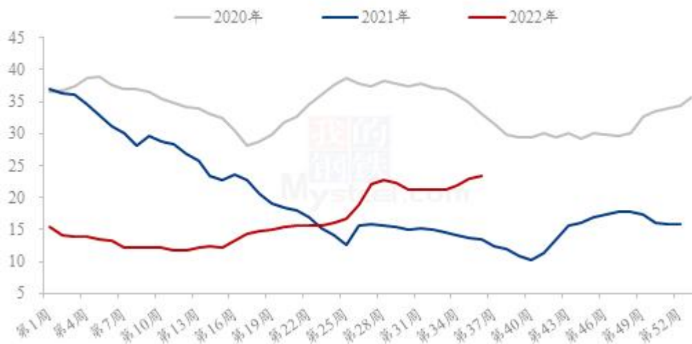
全国外三元生猪出栏均价走势图（元/公斤）