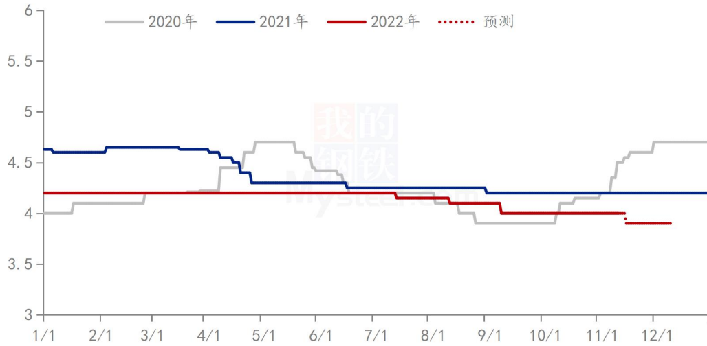
(2020-2022年) 商品绿豆价格走势图 (单位: 元/斤)