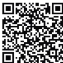
（期、现货铜交易微信）