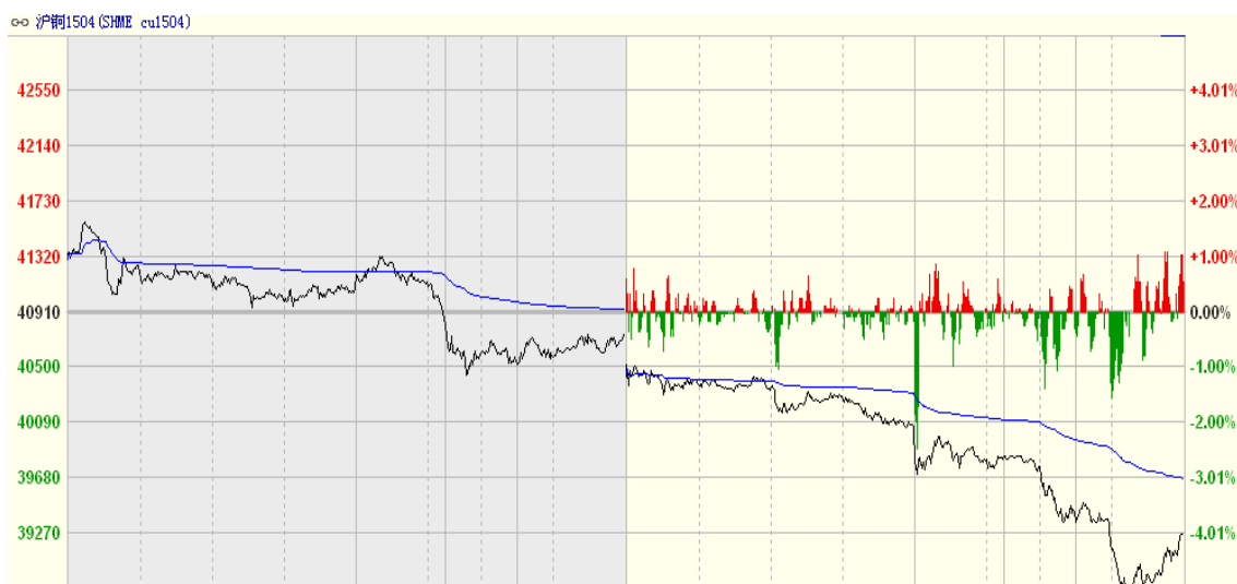
图一 26 日沪铜 1504 合约分时走势图