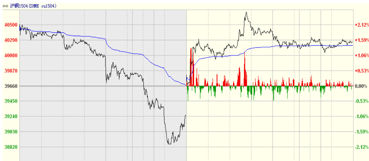
图一 27日沪铜1504合约分时走势图