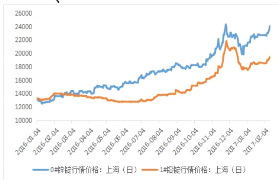
铅锌主流地区期货库存图