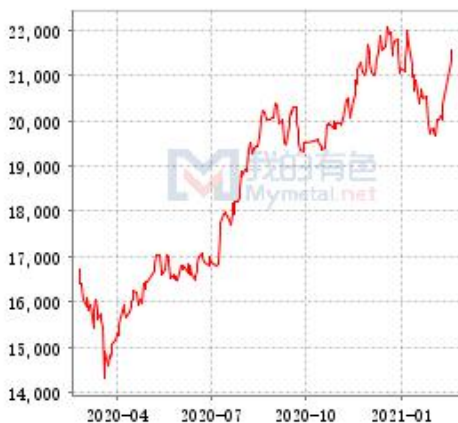
锌 SHFE 与 LME 锌锭库存走势图