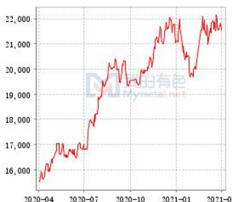
锌 SHFE 与 LME 锌锭库存走势图