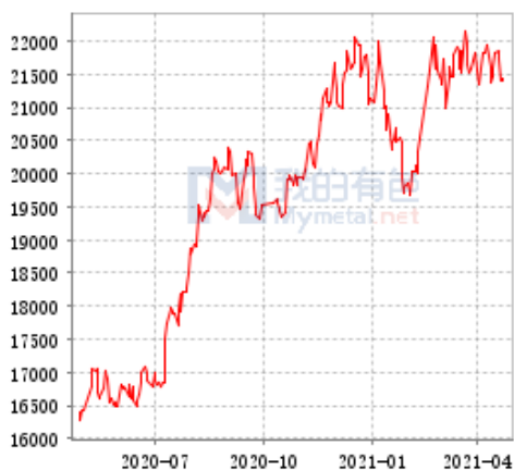
锌 SHFE 与 LME 锌锭库存走势图